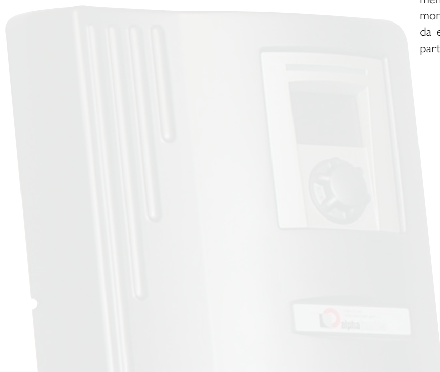
Regolazione Luxtronik a parete

Noi consigliamo il montaggio della pompa di calore su un basamento di cemento. Tutte le tubazioni di allacciamento (mandata/ritorno riscaldamento, cavi elettrici di alimentazione e di comando), vengono collegati con protezione dal gelo, dal basso attraverso una apposita sezione nel fondo. Per lo smaltimento della condensa deve essere previsto uno scarico con protezione dal gelo. Tutte le pompe di calore Alpha-InnoTec sono costruite per un funzionamento particolarmente silenzioso. Nonostante ciò il punto di montaggio deve essere scelto in modo tale da evitare fastidiosi rumori per le persone particolarmente sensibili.